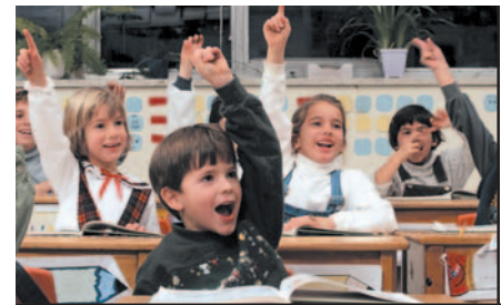
Vivre-ensemble et citoyenneté