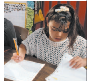
Orientation et entrepreneuriat