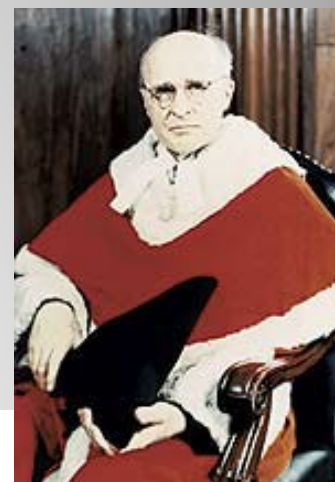
Ivan Cleveland Rand 1884-1969

Prélèvement automatique sur la paie pour tous les salariés bénéficiant de la convention collective.